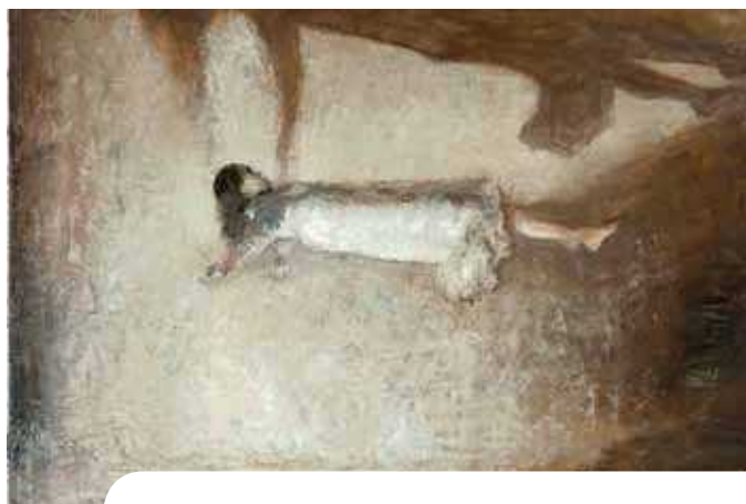
▲ Goran Djurović: Die Schwebende , 2011

© Goran Djurović. Galerie Zuid, Antwerpen