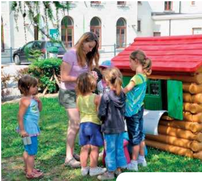
▲ Accueil de jour

L'hiver est encore à nos portes que déjà on pense aux vacances d'été. Pour le plaisir d'abord, pour s'organiser ensuite. Un exercice qui relève parfois du casse-tête quand on a des enfants.