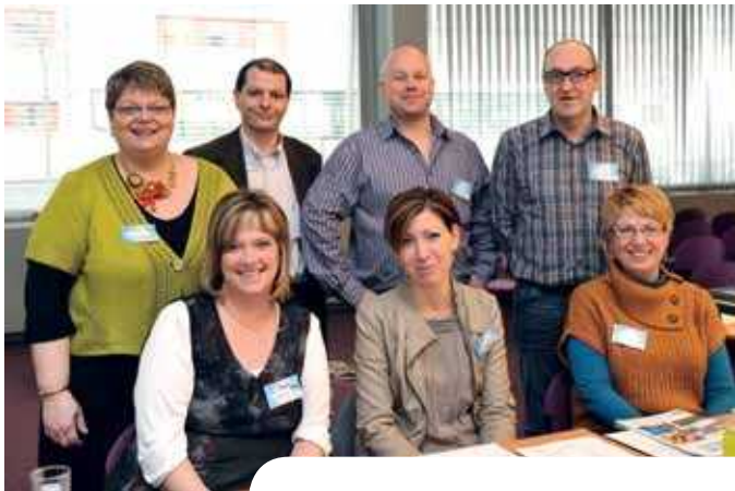
▲ Quelques collaborateurs des points de contact pour les pensionnés

600! Vous avez été 600 à participer à la journée d'information organisée à l'initiative de la Solidarité Sociale au sujet des voyages pour les pensionnés.